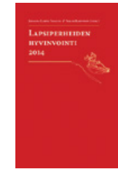
Lammi-Taskula Johanna & Karvonen Sakari. 2014. Lapsiperheiden hyvinvointi 2014. THL. Teema: 21. Suomen Yliopistopaino Oy, Tampere.

Ammatillisesti sadutus antaa mahdollisuuden kohdata lapsen tasavertaisena, juuri sellaisena kun hän on. Voisiko vaikka osastokäynnillä lapsi kertoa tarinan hänen kuulumisiensa tenttaamisen sijaan? Voisiko alkuun varata aikaa tutustumiseen sadutuksen avulla? Ehkä palautetta jaksosta voisi tulla loppuviikosta saduttamalla? Minkälaisen tarinan sinä kertoisit minulle tänään? Kuuntelisitko sinä todella minua?